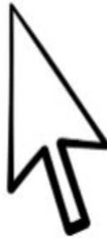
المؤشر الذي يظهر على الشاشة أثناء تحريك الفأرة mouse