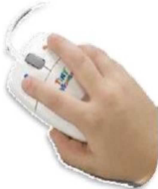
الطريقة الصحيحة لإمساك الفأرة mouse

Mouse : هي وحدة تحكم وإدخال الأوامر و ذلك عن طريق تحريك مؤشر الشاشة