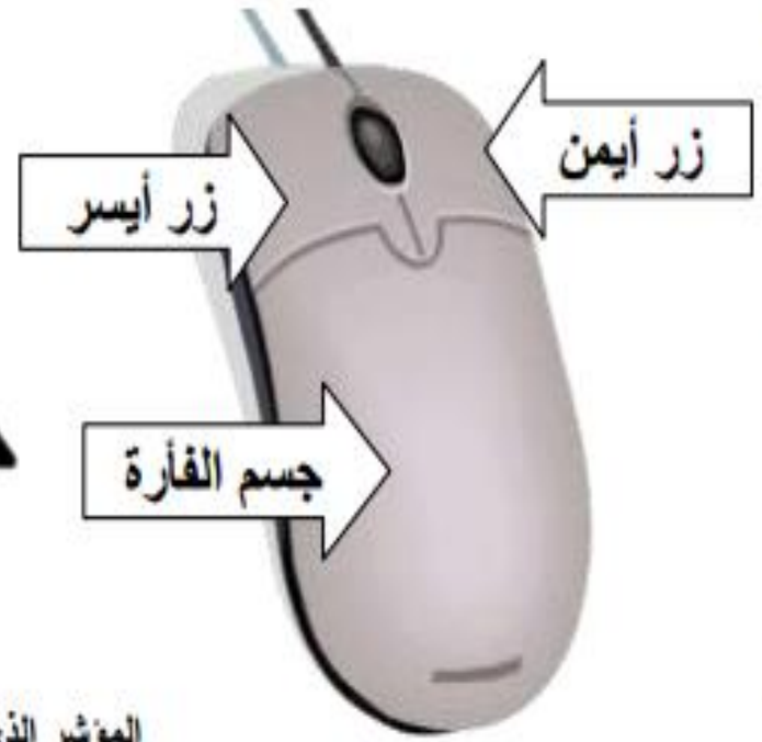
مكونات الفأرة mouse